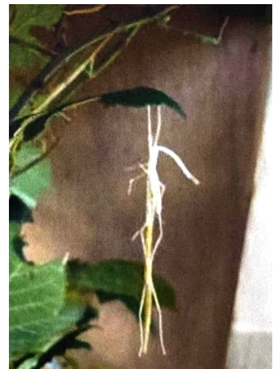
Un phasme qui mue.

Classe de GS - École maternelle Pignoux Bourges