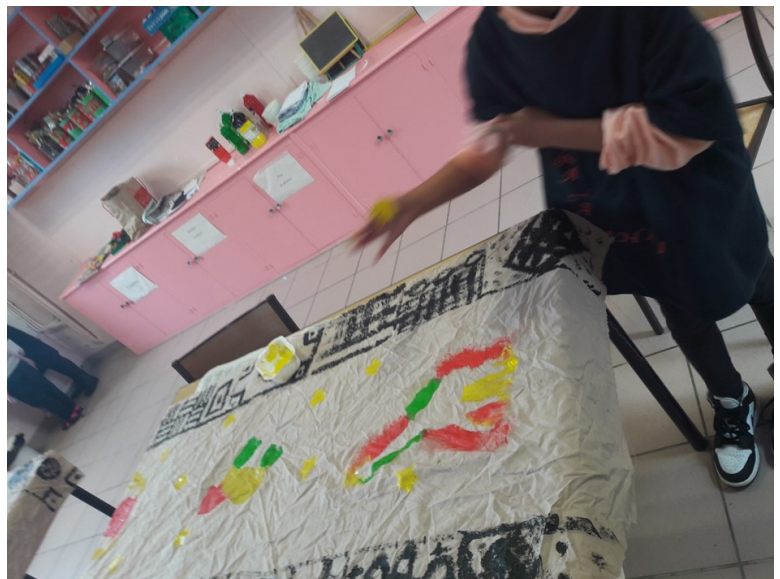
Peinture sur tissu inspirée des motifs des étoffes Ndiop du Cameroun

Nous avons lu l'histoire d'une petite fille se nommant Rafara qui manque de se faire manger par un monstre. Mais ça...ça n'arrive que dans les histoires ! C'est pour ça qu'on donne des fournitures scolaires aux enfants du Cameroun, pour qu'ils se sentent mieux.