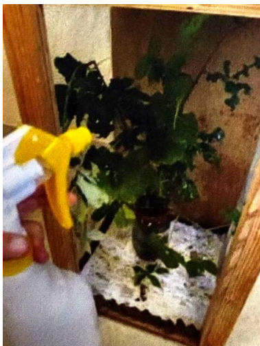
Arrosage des ronces