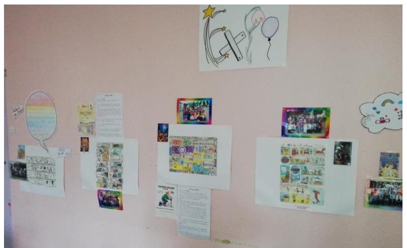
Classe de CM2 École élémentaire Les Talleries Trouy

BDÉCOLE est un musée vivant et de transmission qui a été entièrement pensé, créé et présenté par les CM2 qui sont devenus commissaires d'exposition. Ils ont aussi réalisé un Livre d'or dont les bulles reçoivent les messages des visiteurs du musée. Une belle expérience !