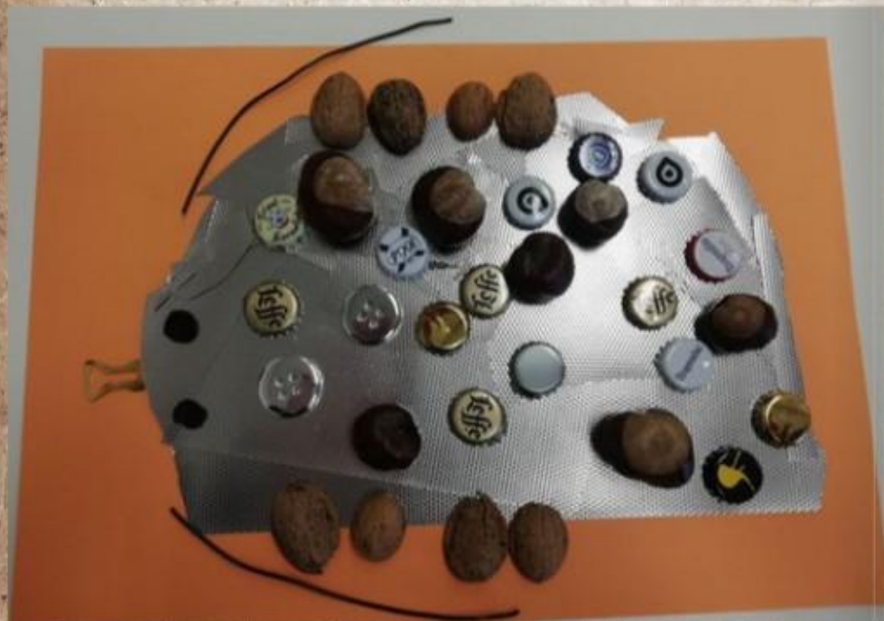
Coccinette la coccinelle