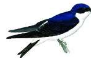
L'hirondelle de fenêtre

Tout ça parce que j'ai regardé Parce que j'ai vu Parce que j'ai écouté Tout ça parce que j'ai entendu Et tout ça j'ai admiré