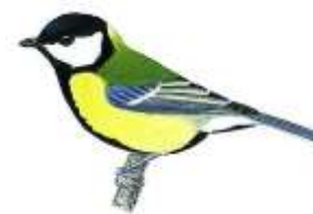
La mésange charbonnière