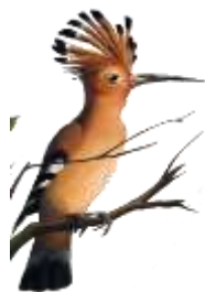
La huppe fasciée