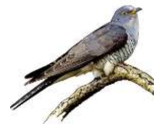
Le coucou gris