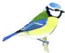
La mésange bleue