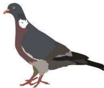
Le pigeon ramier