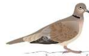
La tourterelle turque