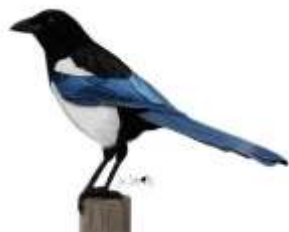
La pie bavarde

Tout ça parce que j'ai regardé Parce que j'ai vu Parce que j'ai écouté Tout ça parce que j'ai entendu Et tout ça j'ai admiré