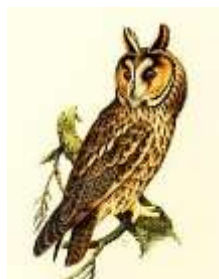
Le hibou moyen duc