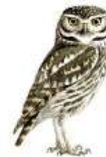
La chouette chevêche