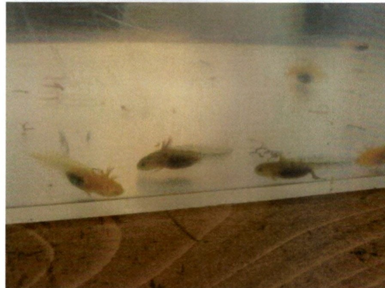
Bébés avec des pattes avant et arrière

Les bébés mangent des artémias (ce sont de minuscules crevettes) puis dès l'apparition des pattes avant nous pouvons leur donner des vers de vase.