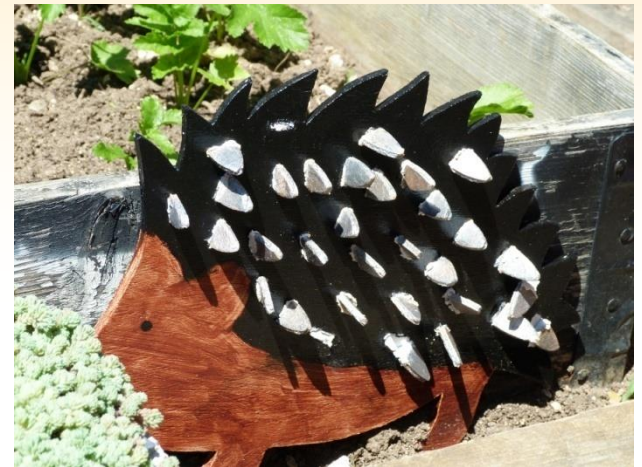
Hérisson du jardin de l'école primaire de Saint-Germain des-Bois

Pour en savoir plus en vous amusant, téléchargez " le jeu de l'Oie du Hérisson " proposé par les amis de la Réserve Naturelle de la Haute Chaîne du Jura.