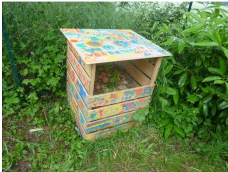
Composteur de l'école élémentaire d'Henrichemont