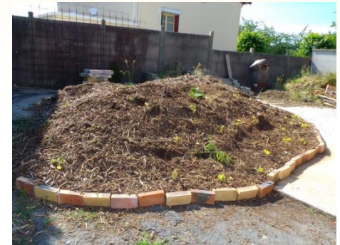
Tas de compost - collège François Le Champi Le Châtelet

Il faut d'abord choisir un espace de stockage en fonction de la dimension du jardin. Par la suite, il faut équilibrer les apports entre déchets riches en azote, humides et mous (déchets végétaux frais et déchets de cuisine) et ceux riches en carbone, secs et ligneux (feuilles mortes, tiges sèches, broyat). Les déchets secs permettent de maintenir de l'air dans le tas et évitent de transformer votre compost en tas malodorant. Il faut aussi maintenir un taux d'humidité suffisant et brasser régulièrement les différentes couches.