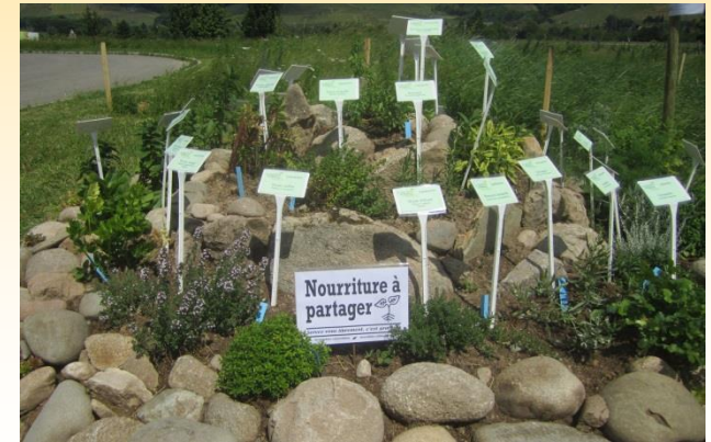
Spirale d'aromatiques du lycée agricole de Wintzenheim (Alsace)

Vous trouverez un plan et des indications pour la construction de votre spirale dans le numéro 199 du magazine «Les 4 saisons du jardin bio» et sur le site : Prise de Terre