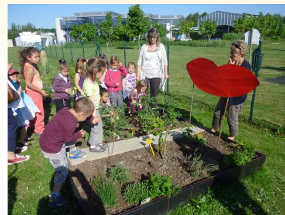
Jardin des cinq sens Groupe scolaire Henri Foucher Belleville-sur-Loire (PS à GS)

Ce jardin pourra prendre différentes formes : potées, jardinières ou encore carrés comme ceux de l'école de Belleville-sur-Loire. Vous pourrez ainsi y installer vos plants et vos boutures dès la fin du mois de mars.