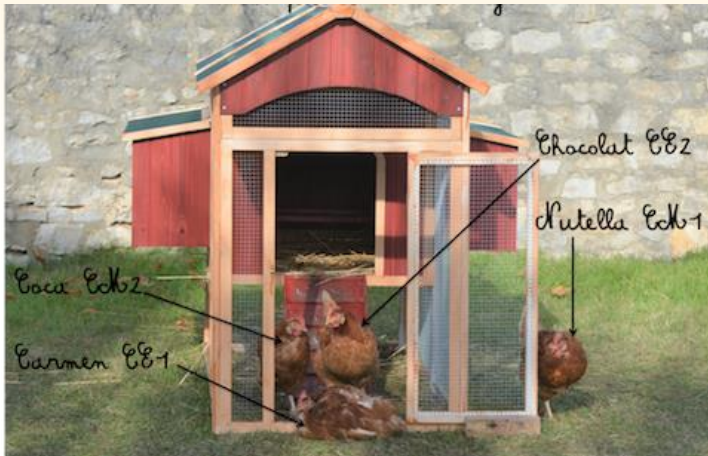
Poulailler de l'école élémentaire publique de Bannegon financé grâce à « La Trousse à projets »

Les poules aiment gratter et picorer. C'est leur nature ! En liberté au jardin, elles peuvent néanmoins faire quelques dégâts. Un bon moyen de les y installer, surtout dans un petit espace, est de les loger dans un poulailler que vous pouvez facilement déplacer. Ce lieu de bien-être permet aux animaux d'être protégés du froid, du vent ainsi que de l'humidité. Vos poules peuvent y pondre ou y couvrir dans les meilleures conditions possible. En principe, le poulailler doit au moins contenir un pondoir, un perchoir, un abreuvoir, une mangeoire et des nids.