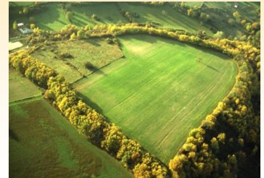
Le Camp de César Chemin de Paletaux 18200 La Groutte

Une exposition « Le Camp de César », avec entrée libre, présente le site ainsi que la partie géologique et la partie botanique (orchidées et prairie calcicole).