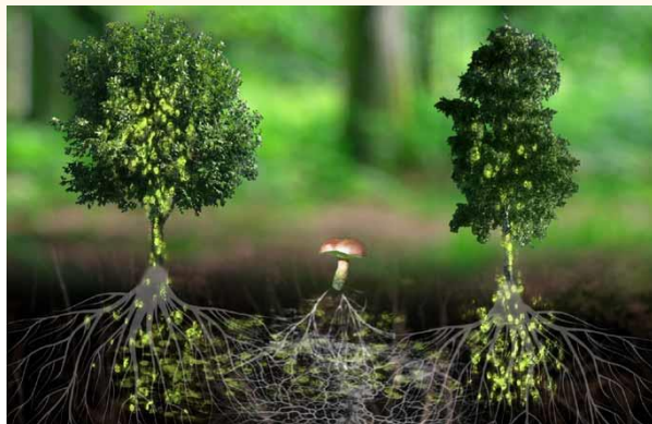
Arbres et réseau mycorhizien