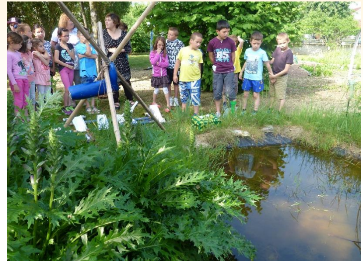
Jardin de l'école élémentaire de Levet