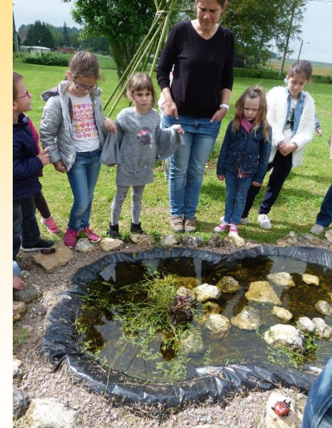
Ecole primaire de Feux

Pour agrémenter votre mare, vous pouvez éventuellement prélever dans la zone humide la plus proche quelques spécimens de végétation aquatique : joncs, massette, iris, menthe... (attention à ne faire que de petits prélèvements !).