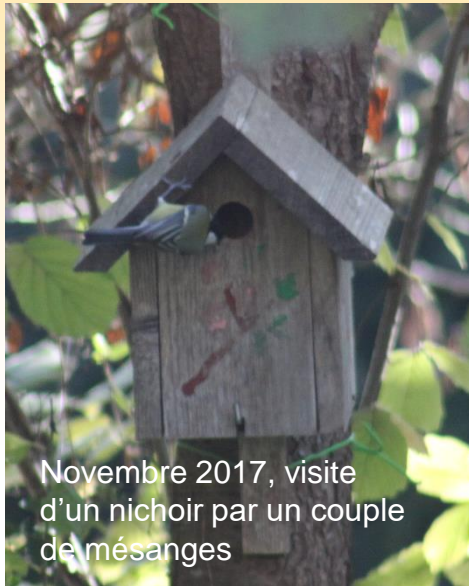
Novembre 2017, visite d'un nichoir par un couple de mésanges