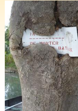
Arbre avaleur de pancarte Marais de Bourges

Photographiez, à votre tour, votre arbre remarquable et envoyez votre photo à l'adresse suivante : occe18@gmail.com Nous dresserons ainsi une carte des arbres extraordinaires remarqués par les écoliers du département.