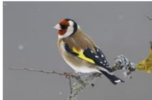
Chardonneret élégant ( Carduelis carduelis )