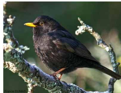
Merle noir , mâle, Photo France DUMAS/ LPO