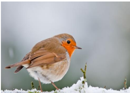
Rouge-gorge familier ( Erythacus rubecula )