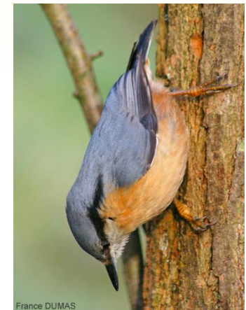
Sittelle torchepot