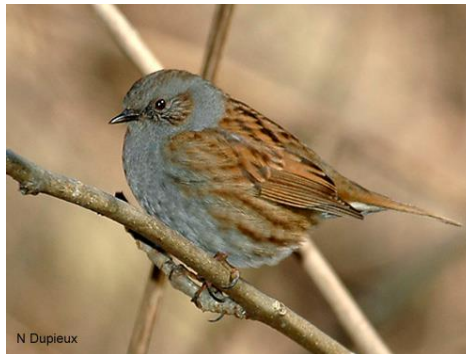
Accenteur mouchet