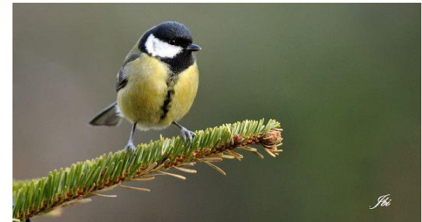
Mésange charbonnière ( Parus major )