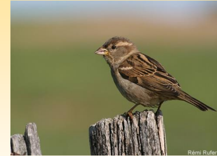
Moineau domestique

Le moineau domestique lui était tellement commun que les jardiniers ne lui prêtaient que peu d'attention. Maintenant lui aussi se raréfie. Il a perdu dix-sept pour cent de sa population en dix ans. Pourtant, si vous l'observez, vous verrez qu'il peut se montrer drôle et querelleur. C'est aussi un insectivore reconnu qui pour nourrir ses petits débarrassera le jardin de quantité de pucerons, moucheron, chenilles, installés dans les arbres et les arbustes.