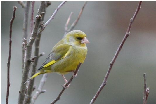
Verdier d'Europe ( Carduelis chloris )

Apprenez donc à les reconnaître pour mieux les protéger.