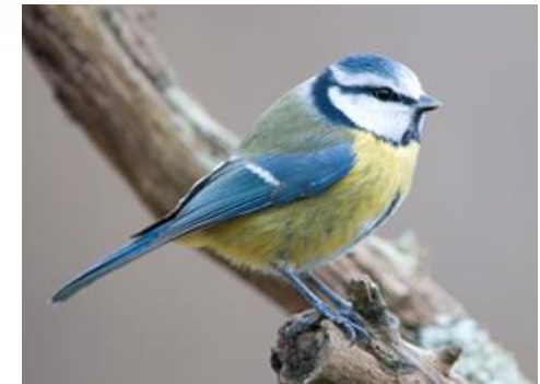
Mésange bleue ( Parus caeruleus )