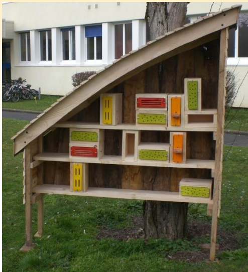
École élémentaire Raoul Néron Saint-Germain-du-Puy

Depuis quelques temps, beaucoup d'hôtels à insectes sont installés dans les jardins. Ils sont de dimensions, de formes et de conception très variables, mais si nous fournissons le gîte aux insectes, il faut aussi penser au couvert !