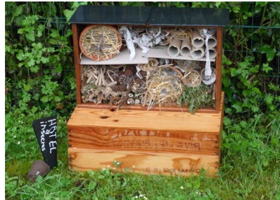
Ecole élémentaire Les Grands Jardins Aubigny-sur-Nère